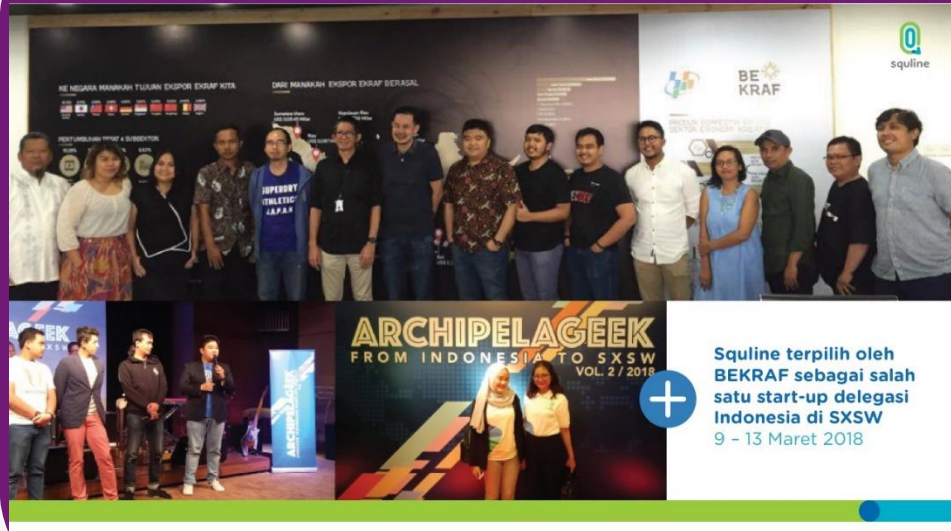
Salah Satu Start-up Delegasi Indonesia di SXSW