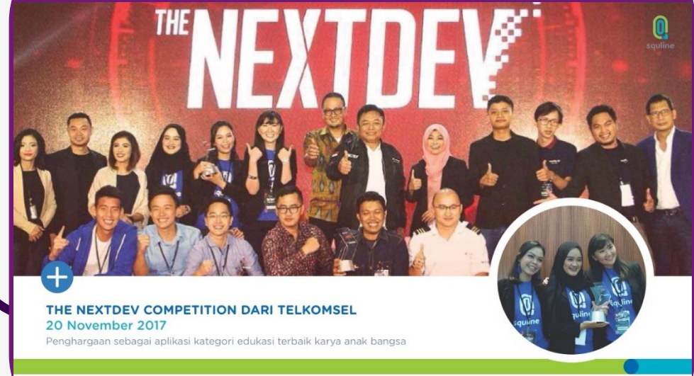
Aplikasi Kategori Edukasi Terbaik Karya Anak Bangsa