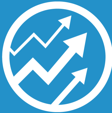
PENGADAAN PERANGKAT PROMO