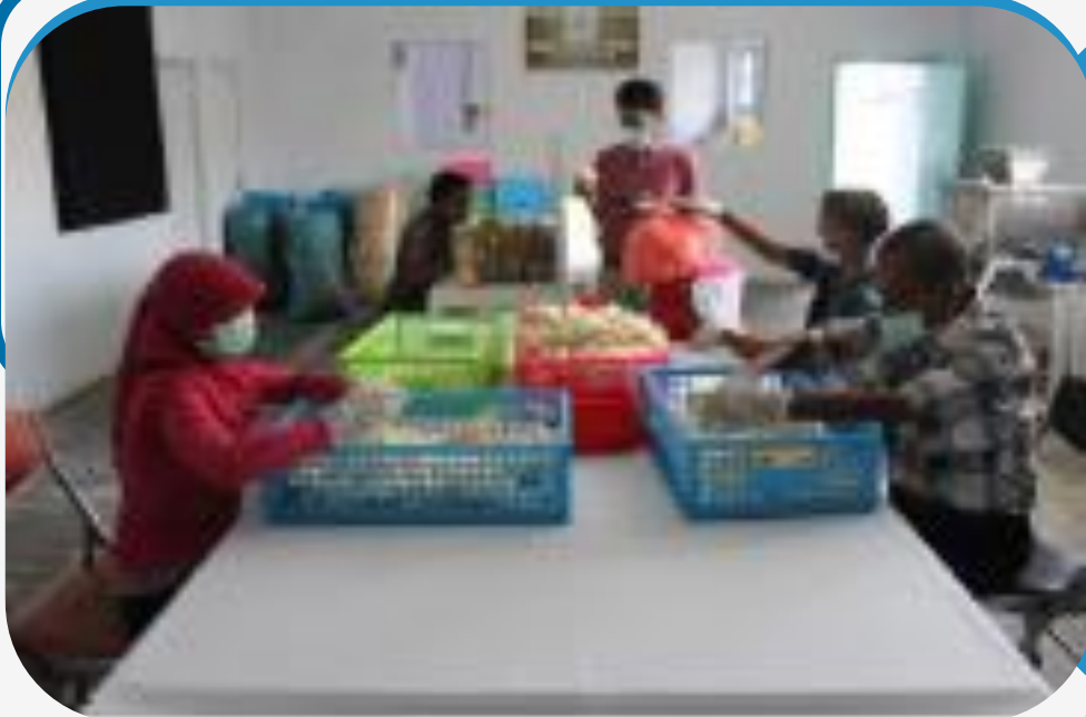
SEGMENT PASAR KONSINASI